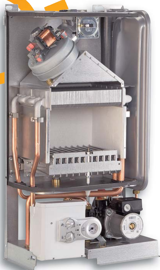
modello F 24